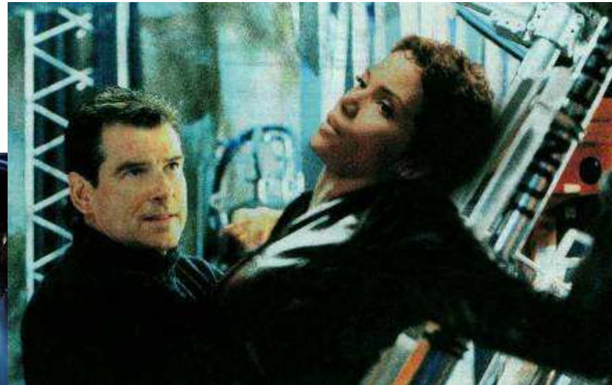
Bilder vom Kinofilm "Stirb an einem anderen Tag"