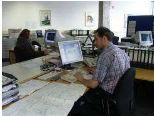
Konstruktion und Entwicklung