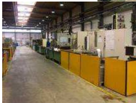
Bearbeitung für die Serienproduktion von Spannern