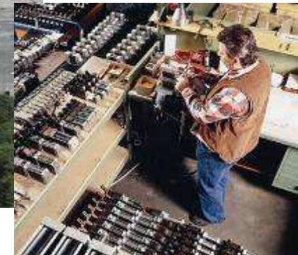
Montage für Spanntechnik und Greifersysteme