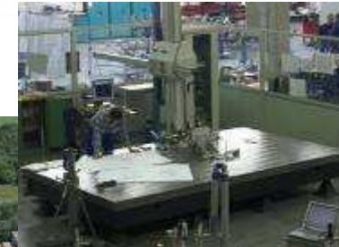
Messmaschinen für Vorrichtungen und Greifersysteme