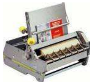
Beleim- und Kaschieranlagen