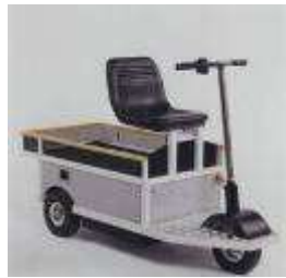
Elektro-Scooter für Transport, Logistik und Freizeit